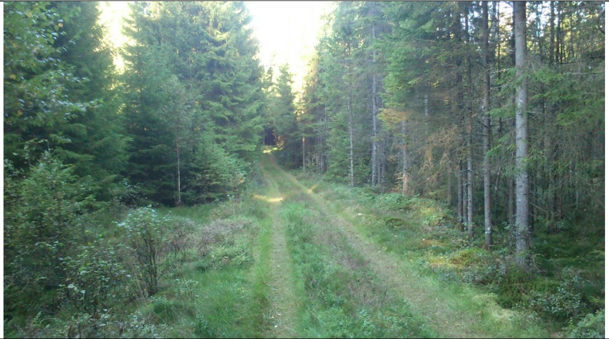
Härlig skogsväg någonstans i närheten av Ullared